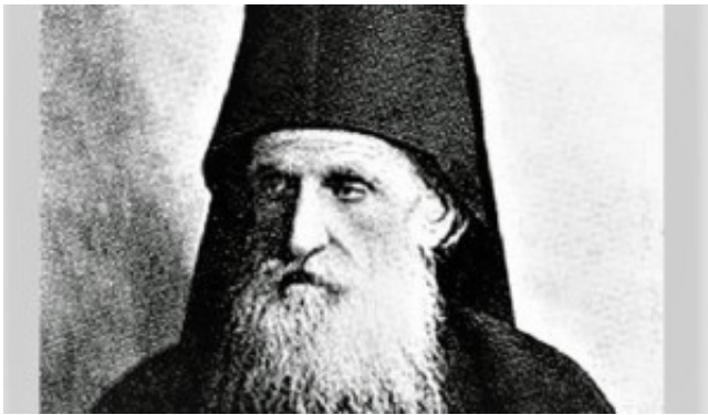
Όσιος Δανιήλ Κατουνακιώτης

Την αναγραφή στο Αγιολόγιο της Εκκλησίας, ανήγγειλε ο Οικουμενικός Πατριάρχης κ.κ Βαρθολομαίος, των αγιορειτών οσίων, Δανιήλ Κατουνακιώτη, Ιερώνυμο Σιμωνοπετρίτη, Ιωσήφ του Ησυχαστή, Εφραίμ Κατουνακιώτη.