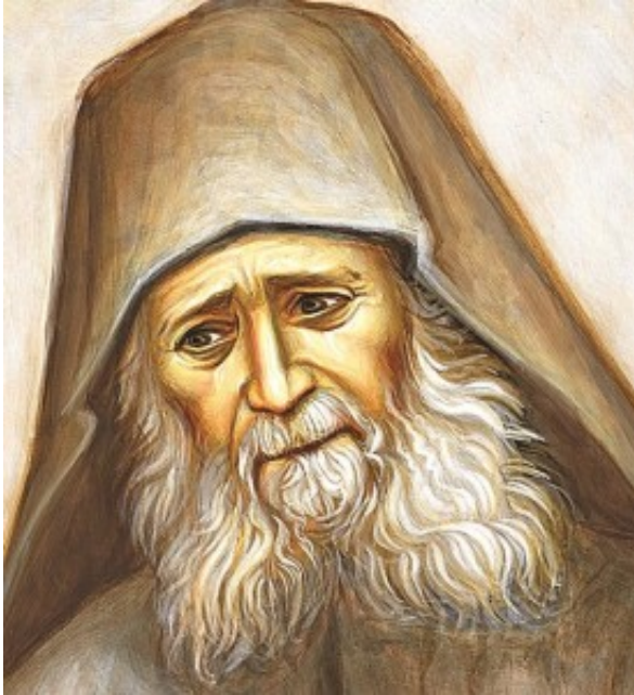
Όσιος Ιωσήφ ο Ησυχαστής

Εν πομπή, όλοι κατευθύνθηκαν εις τον πάνσεπτον ναόν του Πρωτάτου, όπου χοροστάτησε ο Πατριάρχης στην επίσημη Δοξολογία, πλαισιούμενος από τον Πρωτεπιστάτη Γερ. Συμεών Διονυσιάτη, την Ιερά Επιστασία, τους Καθηγουμένους των Ιερών αγιορείτικων Μονών, τον πολιτικό διοικητή του Αγίου Όρους, εκπροσώπους στρατιωτικών αρχών, αγιορείτες μοναχούς και προσκυνητές.