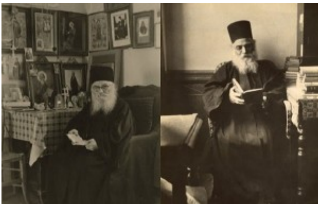
Όσιος Ιερώνυμος Σιμωνοπετρίτης

Εν πομπή, όλοι κατευθύνθηκαν εις τον πάνσεπτον ναόν του Πρωτάτου, όπου χοροστάτησε ο Πατριάρχης στην επίσημη Δοξολογία, πλαισιούμενος από τον Πρωτεπιστάτη Γερ. Συμεών Διονυσιάτη, την Ιερά Επιστασία, τους Καθηγουμένους των Ιερών αγιορείτικων Μονών, τον πολιτικό διοικητή του Αγίου Όρους, εκπροσώπους στρατιωτικών αρχών, αγιορείτες μοναχούς και προσκυνητές.