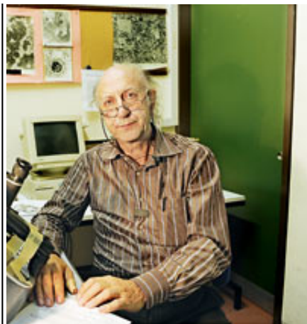
Λουκάς Χ. Μαργαρίτης - Δ/ντής Τομέα Βιολογίας Κυττάρου & Βιοφυσικής στο Τμήμα Βιολογίας του Πανεπιστημίου Αθηνών

Καθημερινά κάνει μετρήσεις και διεξάγει πειράματα σε ποντίκια και έντομα για να διαπιστώσει τις πιθανές συνέπειες της μη ιονίζουσας ακτινοβολίας στους οργανισμούς. Ο καθηγητής Λουκάς Χ. Μαργαρίτης, διευθυντής στον Τομέα Βιολογίας Κυττάρου και Βιοφυσικής στο Τμήμα Βιολογίας του Πανεπιστημίου Αθηνών, μιλάει στο ΟΙΚΟ.