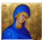
Saint Macrina the Younger: Teacher of Divine Compassion BETH DUNLOP