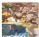
The Church & Sexuality CHRISTOS YANNARAS