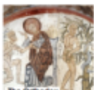
The Orthodox Church, Sexual Orientation & Gender Identity VASILEIOS THERMOS