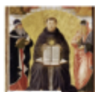
Tangling with Orthodox Tradition in the Modern West BRANDON GALLAHER